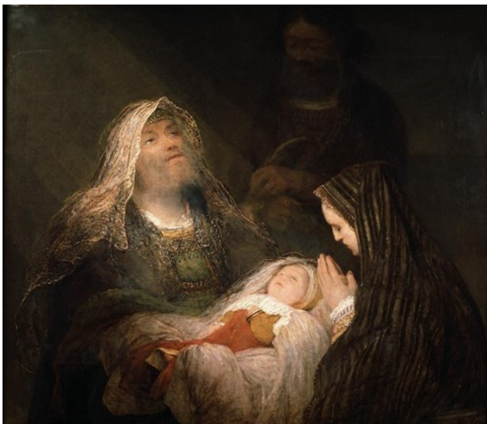
Le Cantique de Siméon , de Arent de Gelder, 1700, Mauritshuis, La Haye.

Pour les péchés contre la vérité de l'unicité du Salut en Jésus-Christ, consistant en la négation ou le doute que la religion catholique est l'unique religion voulue par Dieu