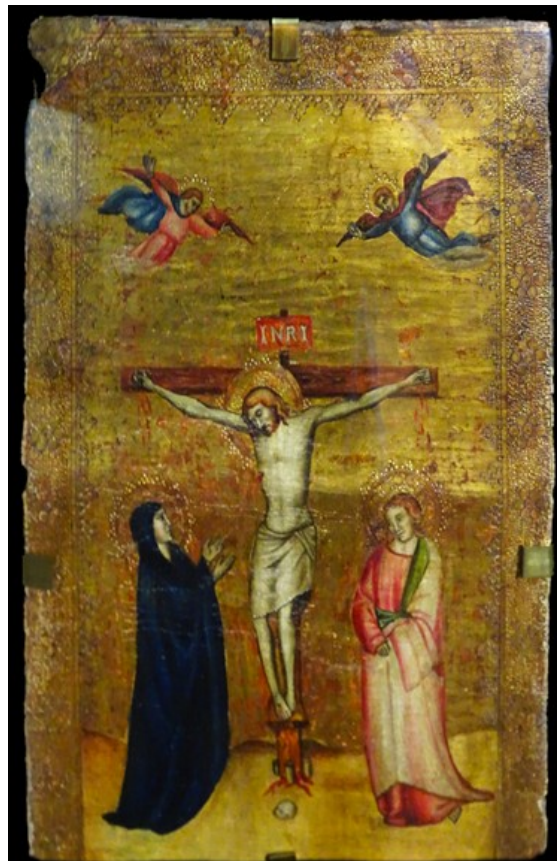
Crucifixion entre la Vierge et Saint Jean, Bernardo Daddi, école toscane, XIVème siècle, Palais de Carnolès, Menton.

La Croix est l'unique Sacrifice pleinement agréé par le Père pour la rémission des péchés et le rachat des hommes.