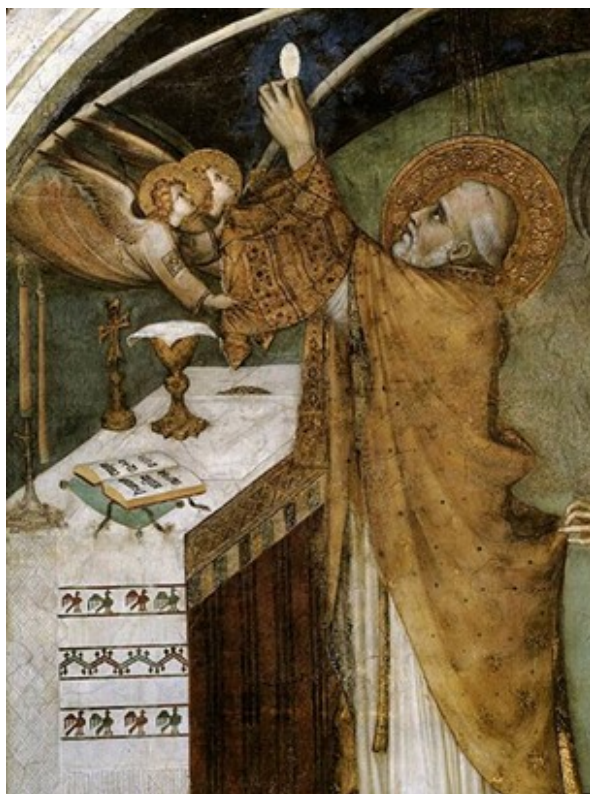
Messe Miraculeuse de Simone Martini (détail), Chapelle Saint Martin, Basilique Saint François, Assise, 1312-1317

Pour les péchés contre la sainteté du sacerdoce, c'est-à-dire les abominations dont de nombreux ministres de Jésus-Christ se sont rendus coupables.