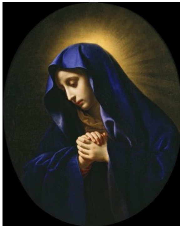
Mater Dolorosa, de Carlo Dolci (1616-1686), circa 1650

Septième Acte de Réparation : Pour réparer l'apostasie silencieuse dans l'Église.