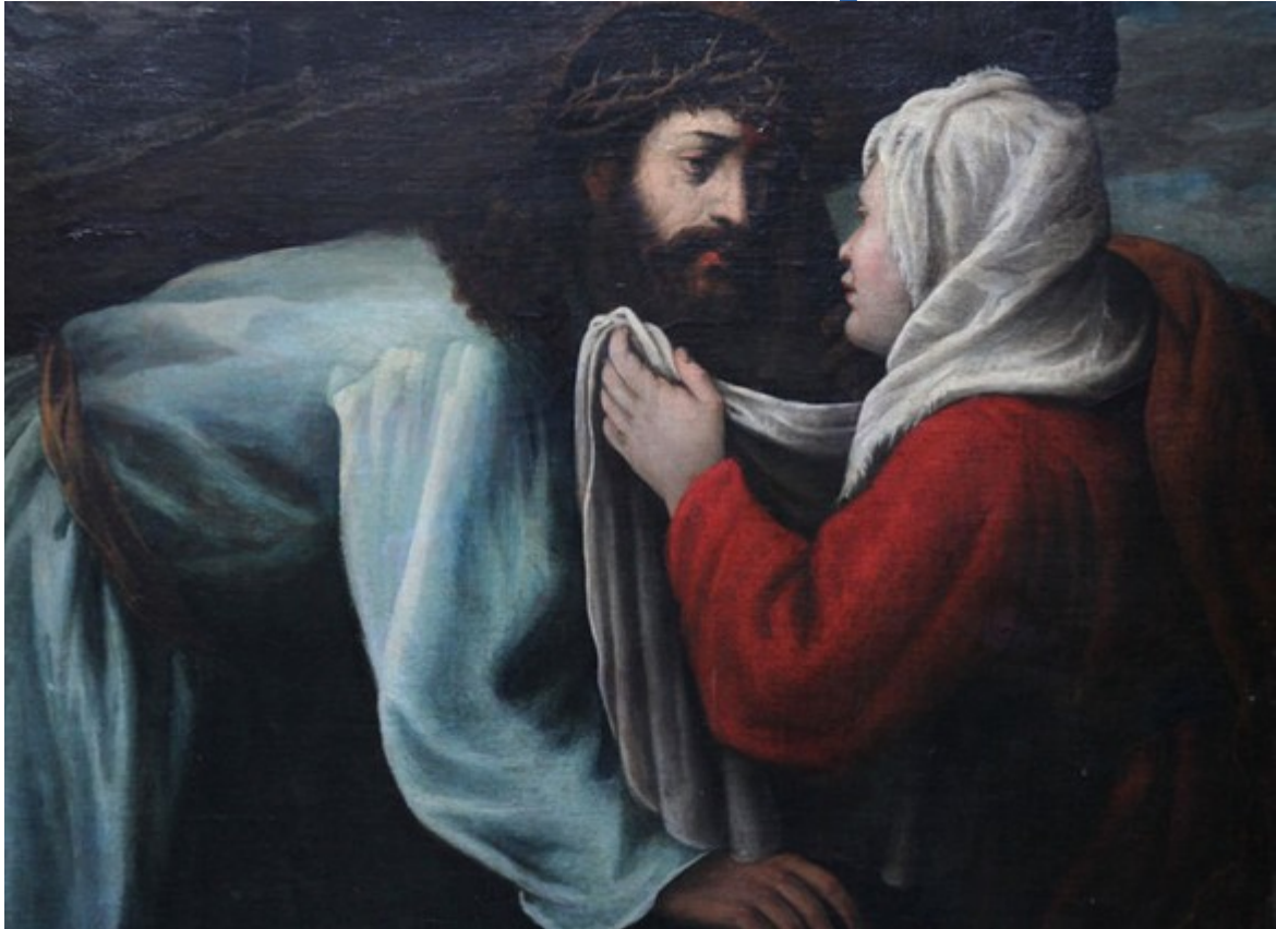
Sainte Véronique essuyant le Visage du Christ, XVIIème siècle, école vénitienne, artiste inconnu, collection privée, Oxfordshire.

Ce beau tableau montre Sainte Véronique essuyant le visage du Christ sur le Chemin du Calvaire. Le linge avec lequel elle a essuyé le visage du Christ se trouve au Vatican et constitue l'un de plus précieux reliques que possèdent l'Eglise. Le peintre a réussi à représenter toute la tendresse et compassion avec lesquelles Sainte Véronique a voulu soulager les douleurs du Christ.