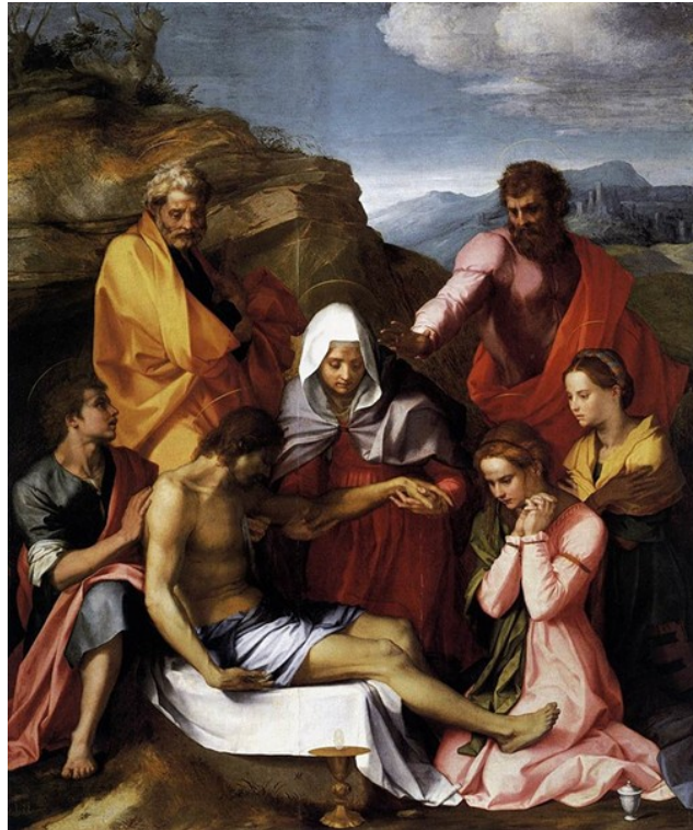
Pietà di Luco , Andréa del Sarto, 1523-1524, Galleria Pallatina, Florence

Sixième intention de réparation : Pour les péchés contre la Sainte Eucharistie.