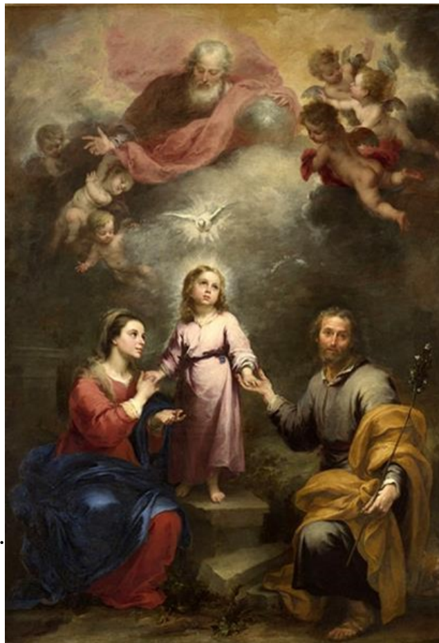
Les 'Deux Trinités', Murillo, 1675-1682, National Gallery, Londres

Troisième intention de réparation : Pour les péchés contre la sainteté du mariage et de la famille