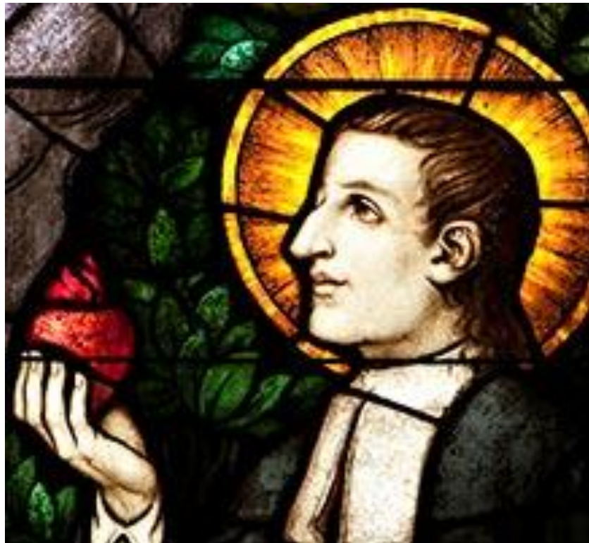
Saint Louis-Marie Grignon de Montfort

33 jours pour se préparer à la Consécration à Notre Dame d'après Saint Louis-Marie Grignon de Montfort