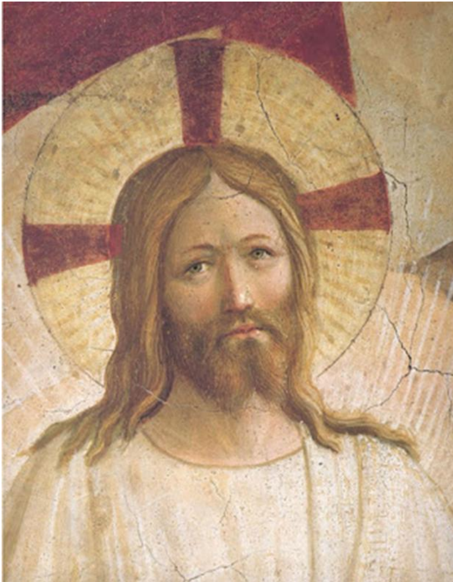
Le Christ ressuscité avec les Saintes Femmes au Tombeau et saint Dominique (détail), de Fra Angelico, 1437-1445, Couvent de San Marco, Florence