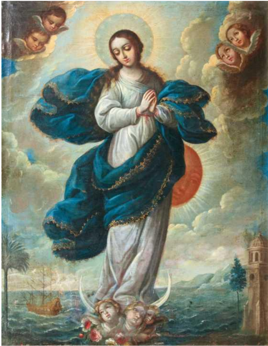
Maria Stella Maris par le Maître de 'Maria Stella Maris, c. 1700.